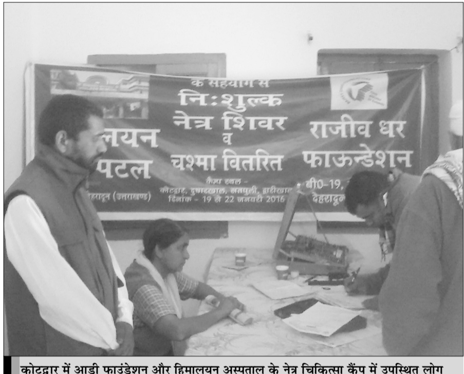
कोटद्वार में आडी फाउंडेशन और हिमालयन अस्पताल के नेत्र चिकित्सा कैंप में उपस्थित लोग

गीर्ट वाइल्डर्स ने मुस्लिम पुरुषों को शरणार्थी केंद्रों में बंद रखने का आह्वान किया था। उन्होंने कहा कि नए साल के मौके पर जर्मनी के कोलोन की घटना के बाद ऐसे कदम डच महिलाओं को सुरक्षित रखने के लिए जरूरी हैं। उनके इस बयान के बाद दंगे भड़के। ‘प्रोटेस्ट ए.जेड.सी हीश’ नाम के एक फेसबुक पेज ने हीश के टाउन हॉल के बाहर समर्थकों से रैली में शामिल होने के लिए कहा था। नगर के अधिकारियों का मकसद एक जनसभा का आयोजन करना था ताकि अगले दस साल में शहर में करीब 500 शरणार्थियों को बसाने पर चर्चा की जा सके।